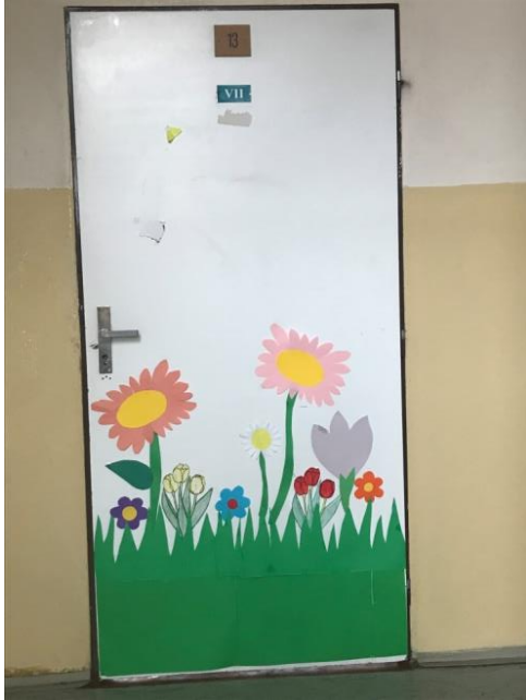
Dveře 7. třídy hezky zdobí krásné barevné květiny.