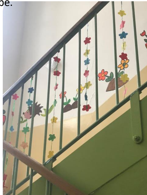
Tyhle nádherné dekorace můžeme vidět na chodbě u 4. a 5. třídy.