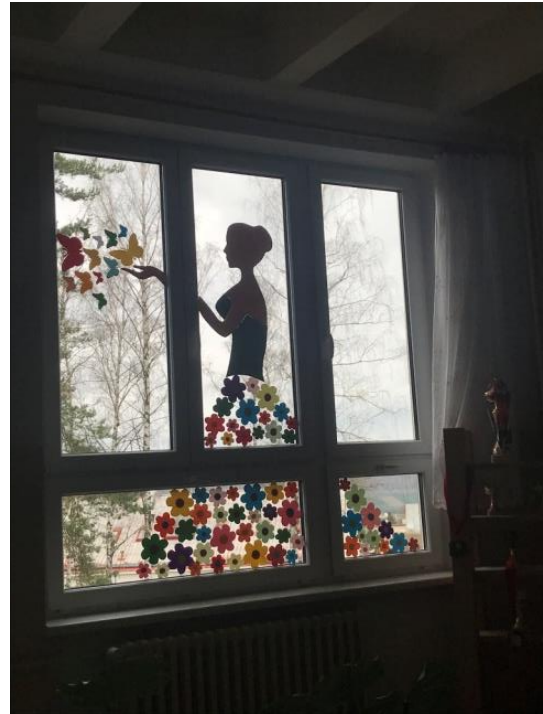
Tohle je krásná jarní výzdoba, kterou můžete vidět na naší školní chodbě.