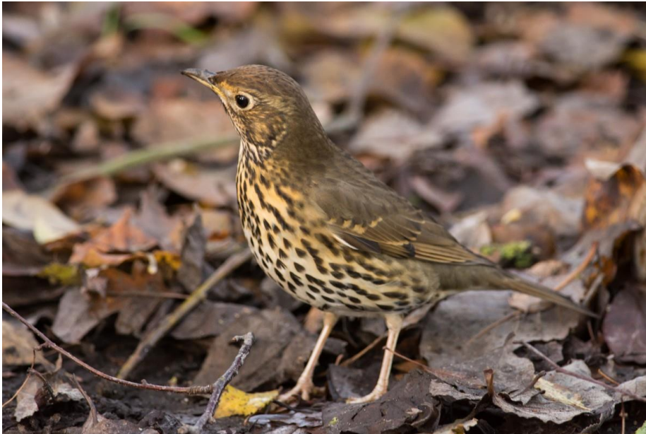
Vypracovala: Karolína Šarišská

Únor je jediným měsícem, ve kterém nemusí nastat úplňk nebo novoluní.