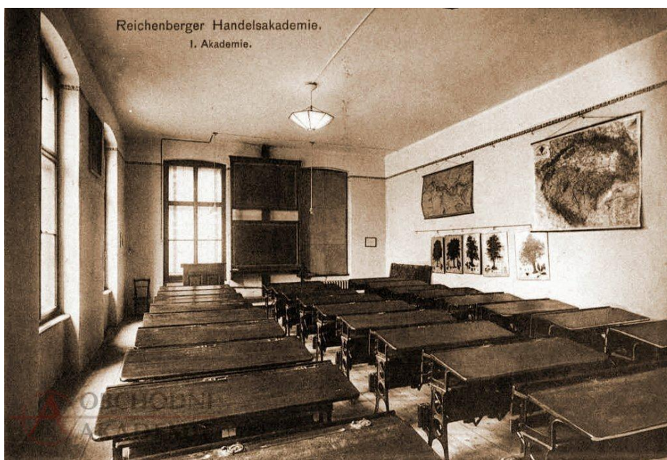
Takhle vypadala třída v 50. letech

Aktovky byly všechny velice podobné. Ty v zásadě monopolně vyráběl jeden z největších výrobců kožené galanterie mezi tehdejšími státy socialistického bloku, Kozak Klatovy. Ty byly z velmi těžké kůže. Byl to poctivý šitý výrobek. Až někdy koncem 60. let se vlastně začaly trochu prosazovat plasty, které se svařovaly a ubraly trochu deka.