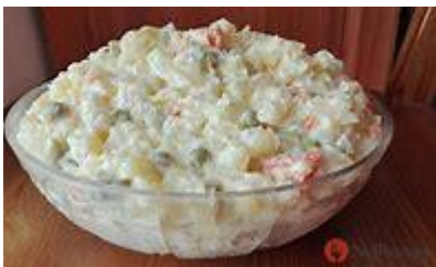
Tradiční český bramborový salát

S předstihem (klidně i denním) uvaříme ve slupce brambory, vejce a mrkev. Pak všechno nakrájíme na malé kostičky. Na kostky nakrájíme také nakládané okurky a cibuli. Přidáme hrášek, sůl, pepř a majonézu s hořčicí podle chuti.