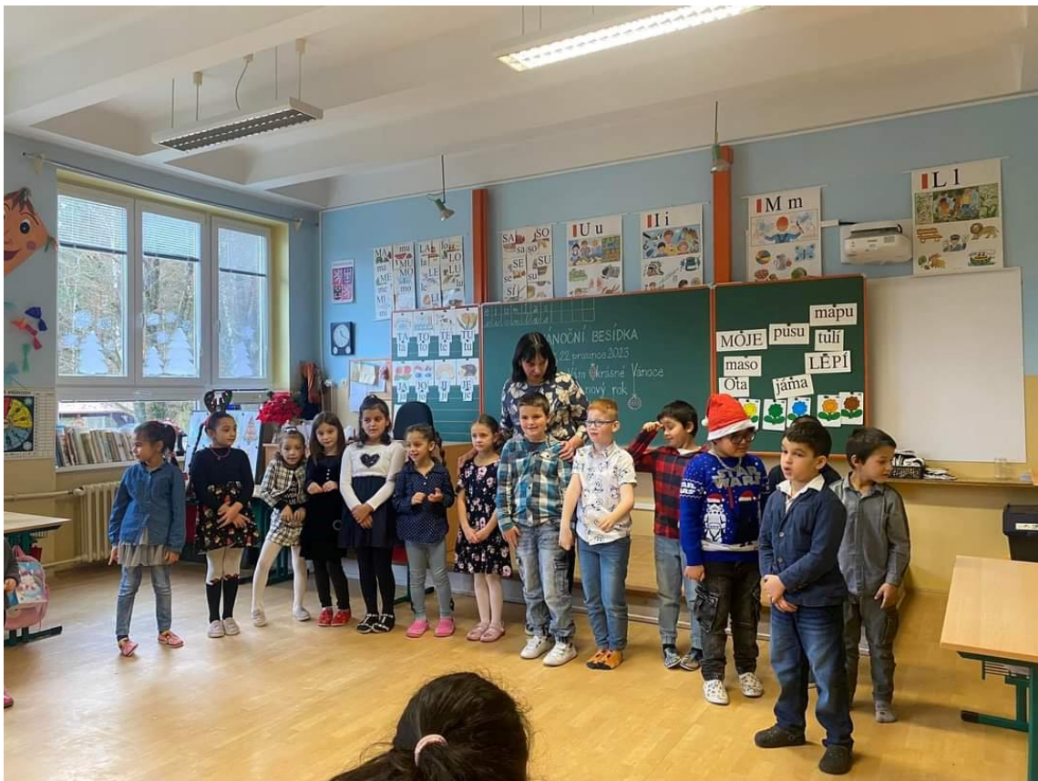
Vypracovali: Matěj Mikolášek a Štěpánka Prokopová